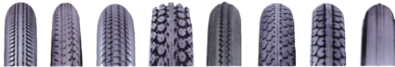
HS 110 HS 127 HS 150 HS 158 HS 187 HS 159 HS 228 HS 302

Wszystkie podstawowe modele opon, za wyjątkiem opon z serii „Light”, wyposażone są w system Puncture Protection - utrudniającą przebicie wkładkę, wykonaną z naturalnej gumy.